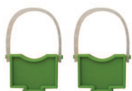
Supporti alti per collettori High manifold supports