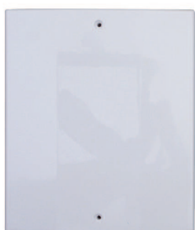
Coperchio Inspection door